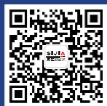
思嘉超能芯公众号