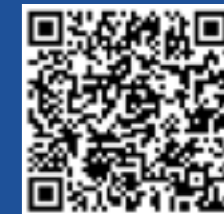
扫码观看维东地材祝福视频