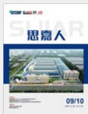
总第 011 期 (2022 年 9-10 月)