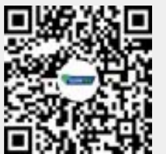
扫码观看迪卡侬祝福视频

—Romain THIZY, Components Strategic Buyer