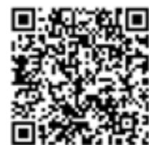
▲ 扫码观看引江蓬帆祝福视频