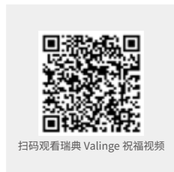
扫码观看瑞典 Valinge 祝福视频